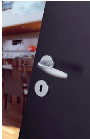
Liegt gut in der Hand: Garnitur aus der Serie New York von Hoppe

Ausgestattet mit einer Kombination aus Druckknopf und Abschließfunktion sorgen die Griffe für eine hohe Basis-Sicherheit am Fenster. Eine Weiterentwicklung der bekannten Schnellstiftverbindung zur werkzeuglosen Türgriffmontage wird im Bereich der Innentüren zu sehen sein. Mit »Schnellstift + « las-