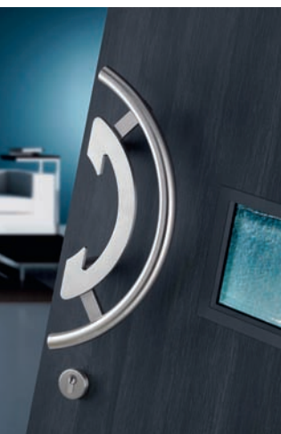
Das große Halboval der Bügelgriffe bietet viel Greiffläche

Der Hersteller von Beschlagssystemen Hoppe stellt in Nürnberg seine Griffinnovationen für Fenster, Innentüren und Außentüren vor. Ein Schwerpunkt sind dabei die Griffe der Serie »New York«.