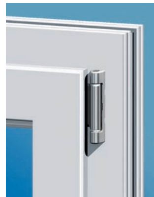
Formschönes Axxent-Ecklager ohne sichtbare Drehpunkte

Öko-Label für alle umweltfreundlichen Produkte von Siegenia-Aubi