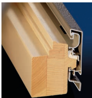
Der Fensterlack Induline LW-720 lässt sich in einem Gang spritzen

In zwei Bereichen können Anwender mit den aktuellen Produkten von Remmers ihre Wertschöpfung steigern. Fenster mit Metallschalen aus Aluminium sind vor direkter Bewitterung geschützt und benötigen daher geringere Mindestschichtdicken als reine Holzfenster. Der Fensterlack »Induline LW-720« wurde auf diese Anforderungen eingestellt und erreicht die notwendigen Schichtdicken nun in einem Applikationsschritt. Die optische Anmutung entspricht der eines hochwertigen Möbellacks. Im Bereich der lasierenden Fensterbeschichtung »Induline GW-360« tritt Remmers