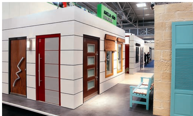
Mit 115 mm Bautiefe: die neuen Haustüren von Kneer

Kneer-GmbH 72589 Westerheim Tel.: (07333) 83-0, Fax: -40 www.kneer-suedfenster.de