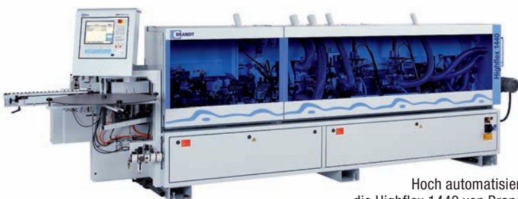
Hoch automatisiert: die Highflex 1440 von Brandt

Der Baukasten macht's möglich: für jeden Bedarf eine passende Säge