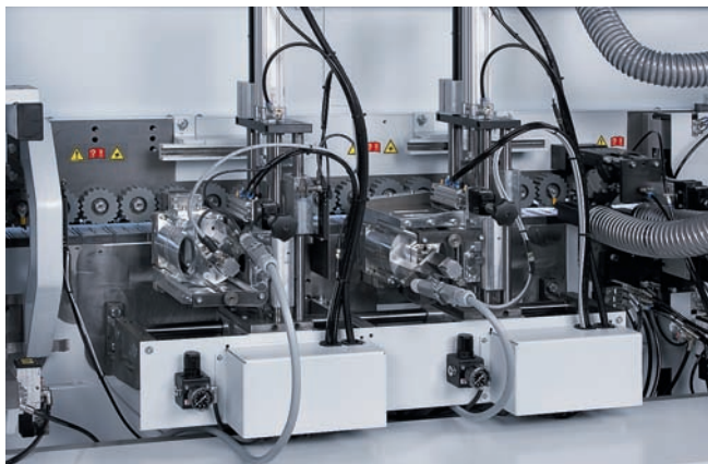
Das Multifunktionsformfräsaggregat mit Lineartechnologie

Mit den beiden »Highflex 1430«- und »Highflex 1440«-Maschinen ist das Highflex-Programm vollständig abgerundet. Diese zwei Maschinen verfügen über einen hohen Automatisierungsgrad und eine umfangreiche Aggregatebestückung, um ein Maximum an Flexibilität zu erreichen. Ein Quickmelt-