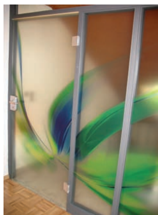
Ob ein Fantasiedekor oder ein Foto: Rometsch bedruckt fast alles

Die Rometsch Digital GmbH & Co. KG bedruckt mit einem Large Format Inkjet-Drucker unterschiedlichste Materialien, von Holz, Schichtstoff,