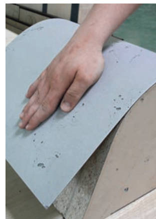
Flexibel: Imi-Beton auf HPL