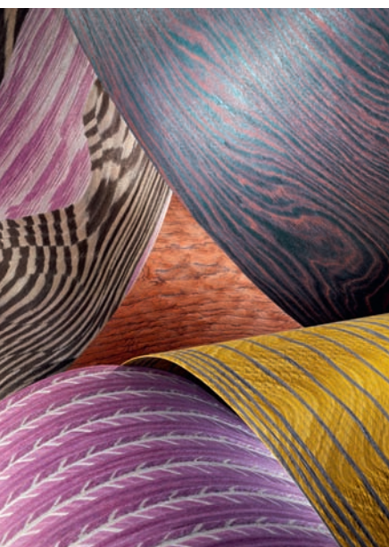
Concept Wood zeigt die Morphologie von Zweigen, Blättern oder Blüten

Die neue Industriefurnier-Kollektion »Concept Wood« des italienischen Herstellers