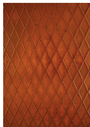
Imi-Rost in Rautenoptik